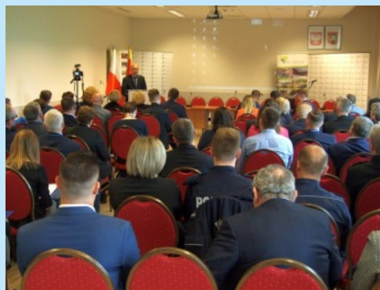
Debatowali o Zbiorniku Dobczyckim str. 7