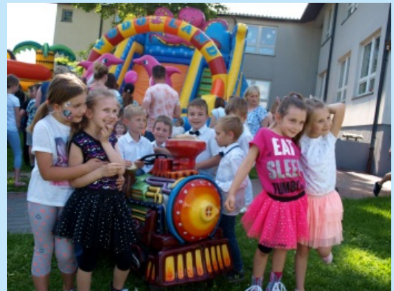
Gminny dzień dziecka str. 16