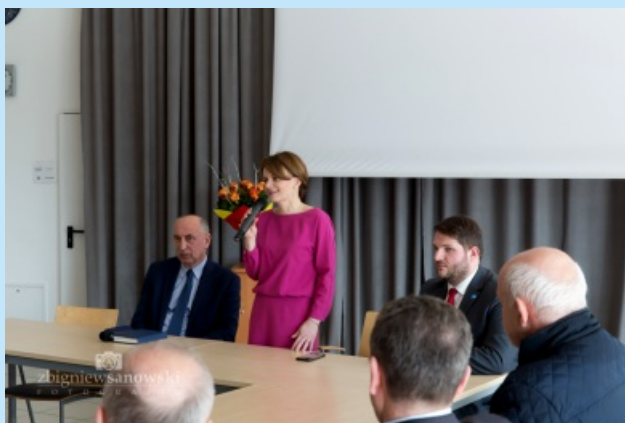
Wizyta Minister str. 6