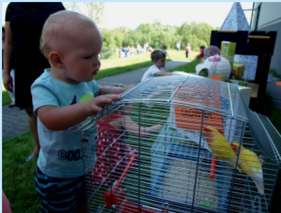
Gminny dzień dziecka str. 16