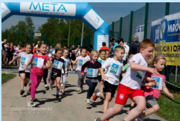
VI Bieg Sieprawska Piątka str. 20