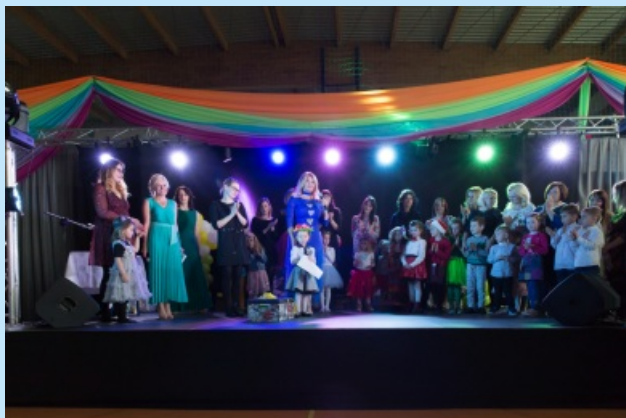
Festiwal Piosenki str. 12