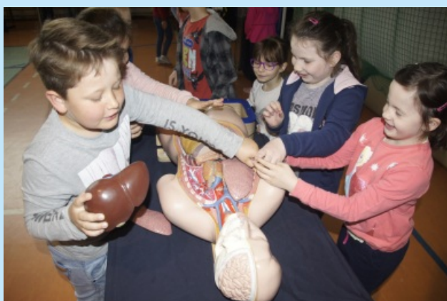
Naukobus str. 12