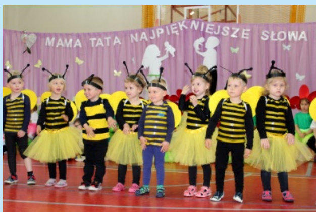
Co nowego w Szkole Podstawowej w Czechówce str. 15