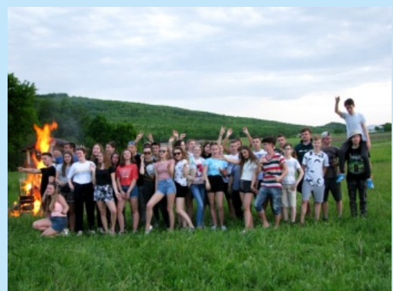
Wymiana międzynarodowa str. 18