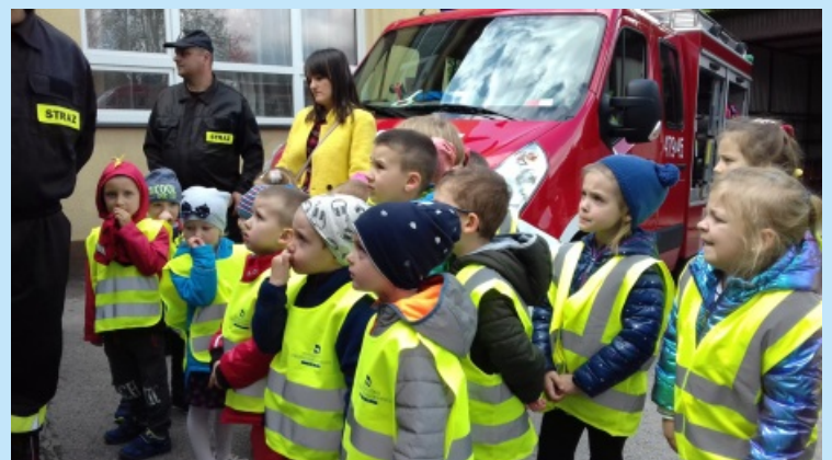
Nasi dzielni strażacy str. 19