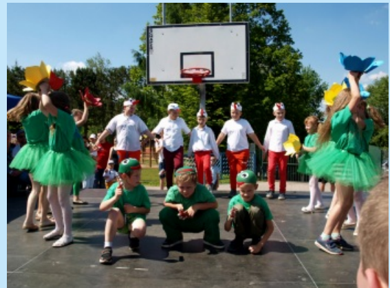
Gminny dzień dziecka str. 16