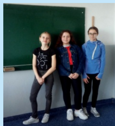
Sukcesy uczniów z Sieprawia str. 13