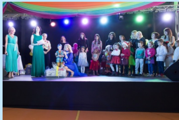
Festiwal Piosenki str. 12