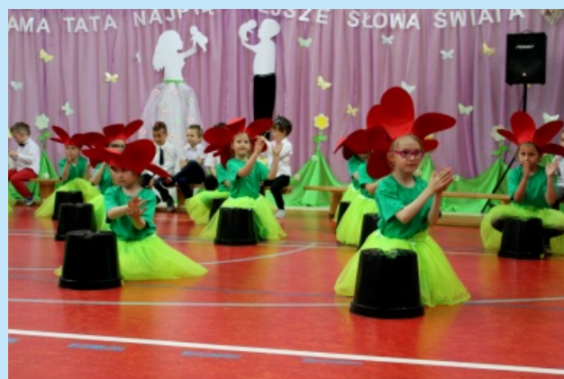
Co nowego w Szkole Podstawowej w Czechówce str. 15