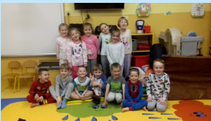
Noc bajek str. 19