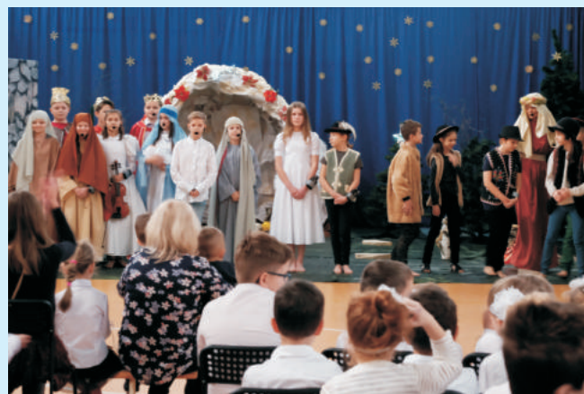
Jasełka w pigułce w SP w Łyczance str. 12