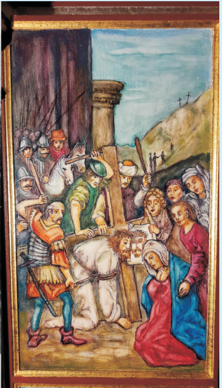
Obraz Droga na Golgotę str. 22