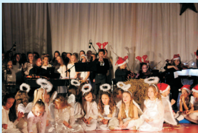
Koncert "I Ty możesz zostać Św. Mikołajem" str. 13