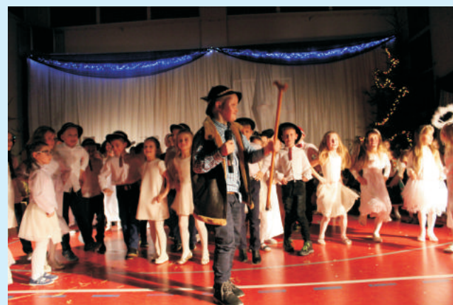
Koncert "I Ty możesz zostać Św. Mikołajem" str. 13