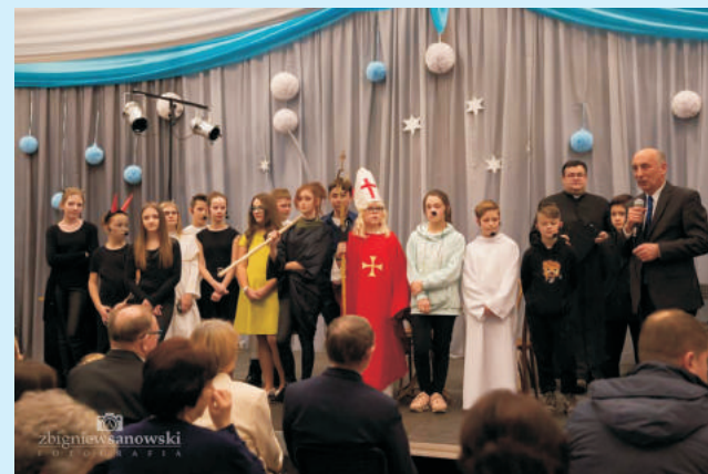
Jasełka "Starcie dwóch mocy" str. 20