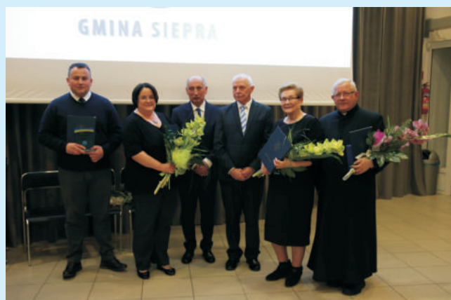
Zasłużeni dla gminy str. 7