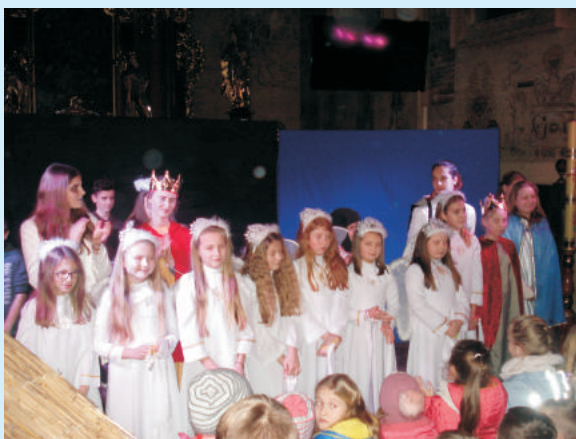
Jakie będą te święta? Jasełka w Zakliczynie str. 11