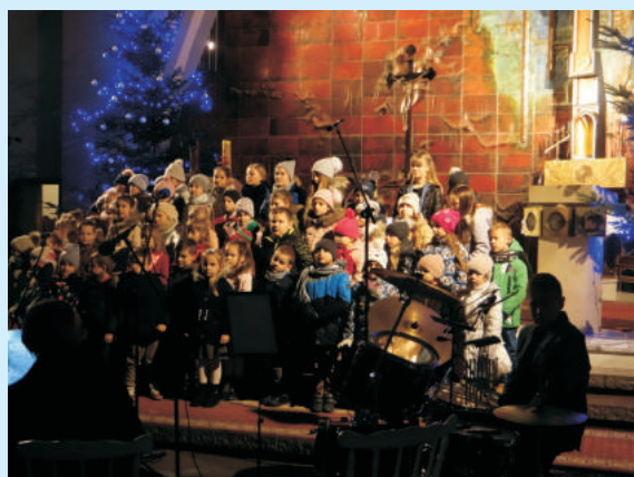
Koncert kołęd - Przyjdź i trwaj str. 13