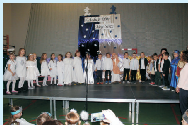
Jasełkowe spotkanie i wspólne kołędowanie "Zaśpiewamy - pomagamy" str.12