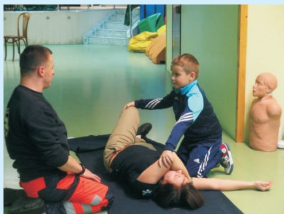
Pierwszaki uczą się pomagać str. 15