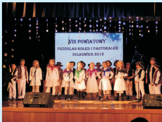
Konkurs kołęd str. 12