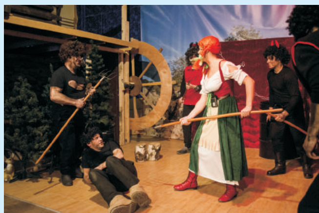
Igraszki z Diabłem w Łyczance str. 25