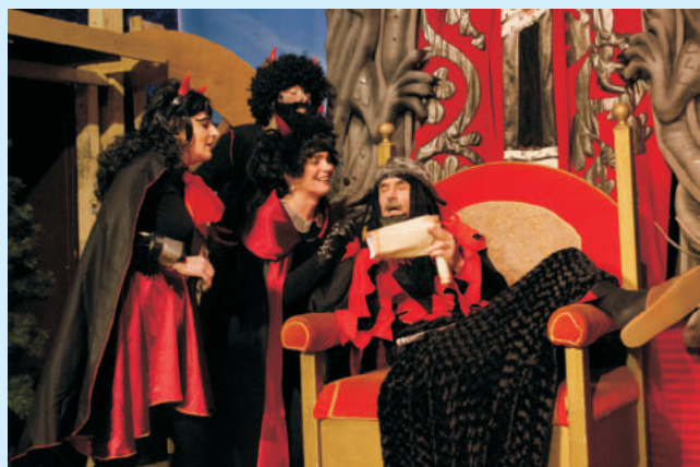
Igraszki z Diabłem w Łyczance str. 25