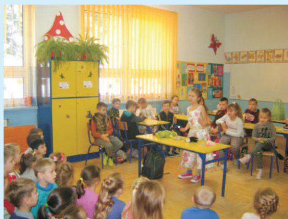
W Magicznym Świecie Baśni str. 19