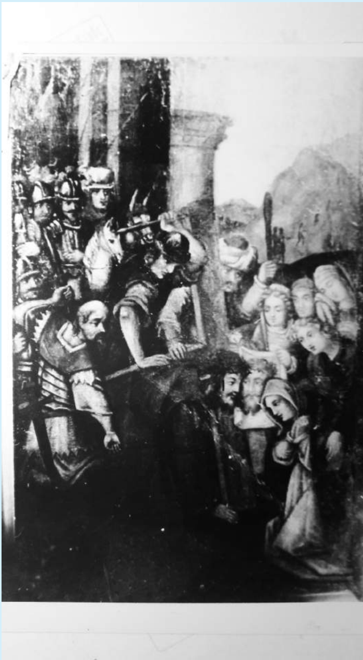
Obraz Droga na Golgotę str. 22