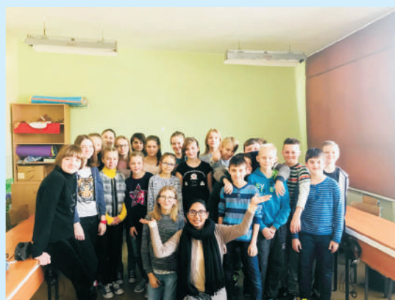
Motywujemy do nauki języka angielskiego str. 17