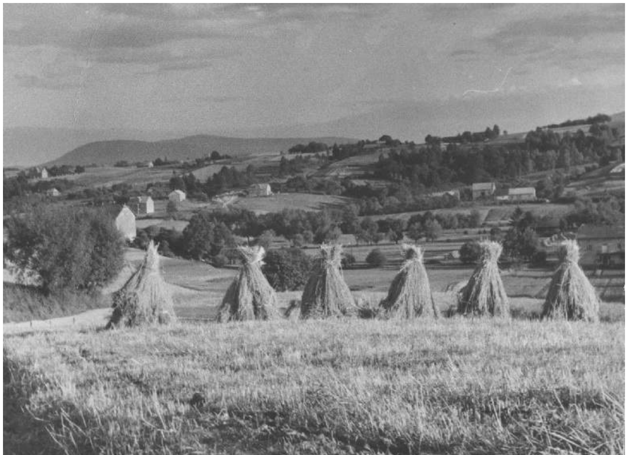
„Podstawki”, czyli ułożone w pryzmę snopki zboża na polu pod kościołem w Sieprawiu, lata 60 ub. wieku.