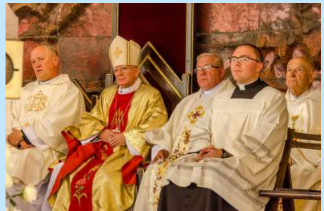
Uroczystość Odpustowa ku czci Błogosławionej Anieli Salawy str. 15