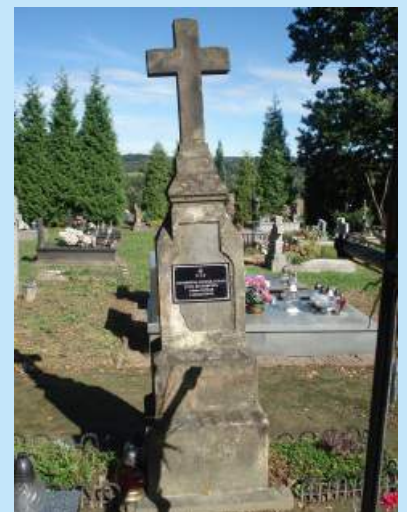
Zapowiedź VII kwesty na cmentarzu w Zakliczynie str. 20