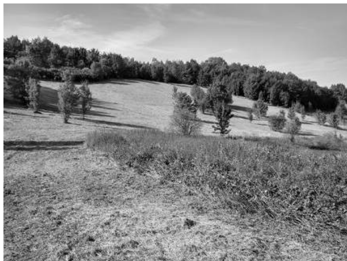
Po pozyskaniu działki Urząd Gminy zlecił jej uporządkowanie i wykoszenie