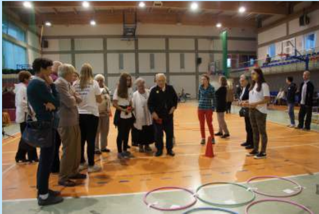
Piknik "Siepraw bez barier" str. 14