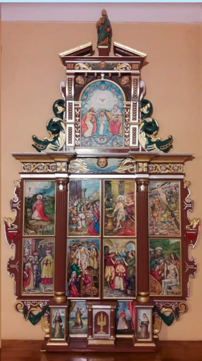
Dawny ołtarz ukrzyżowania w pierwszym kościele św. Michała Archanioła w Sieprawiu - Ołtarz zamknięty