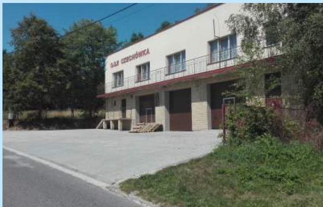
Odnowiony plac manewrowy przy OSP w Czechówce str. 8