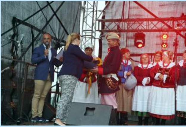
Piknik w Sieprawiu 12.08.2017 str. 13