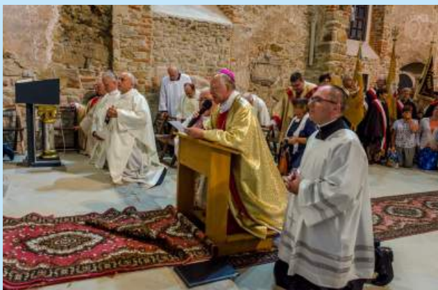
Uroczystość Odpustowa ku czci Błogosławionej Anieli Salawy str. 15