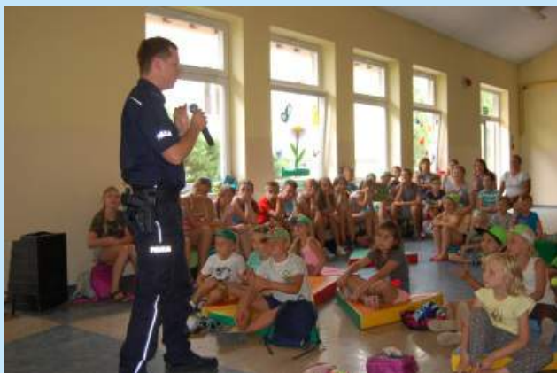
Letnie półkolonie 2017 str. 13