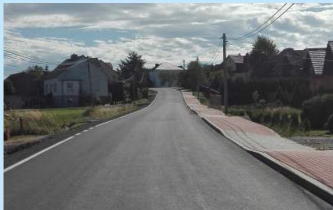
Wyremontowana droga - ul. Kamoinka w Zakliczynie str. 8