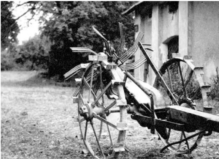
Koparka konna do ziemniaków, majątek dworski w Zakliczynie, 1959 r.