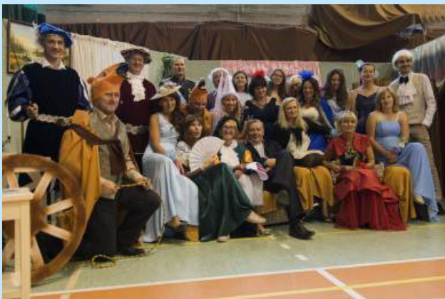
Grupa teatralna z Łyczanki str. 15