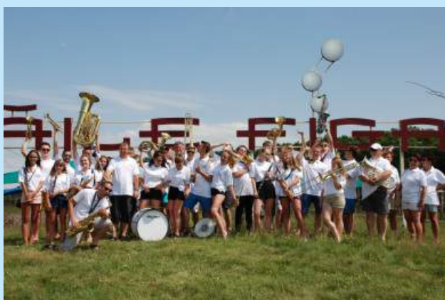
Wyjazd orkiestry Sieprawianka do Rumunii str. 10