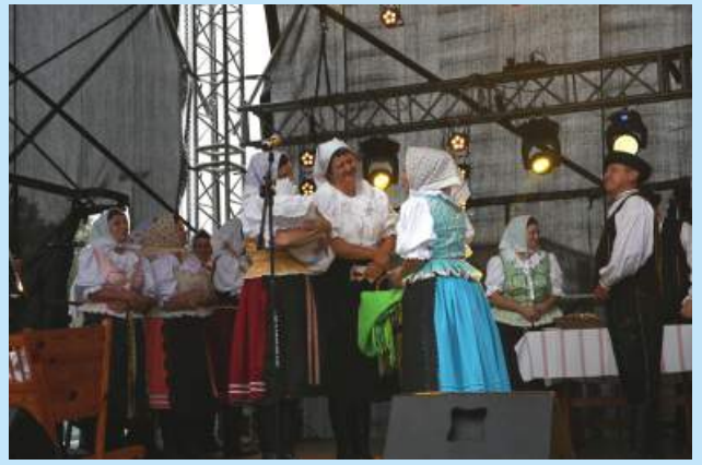
Piknik w Sieprawiu 12.08.2017 str. 13