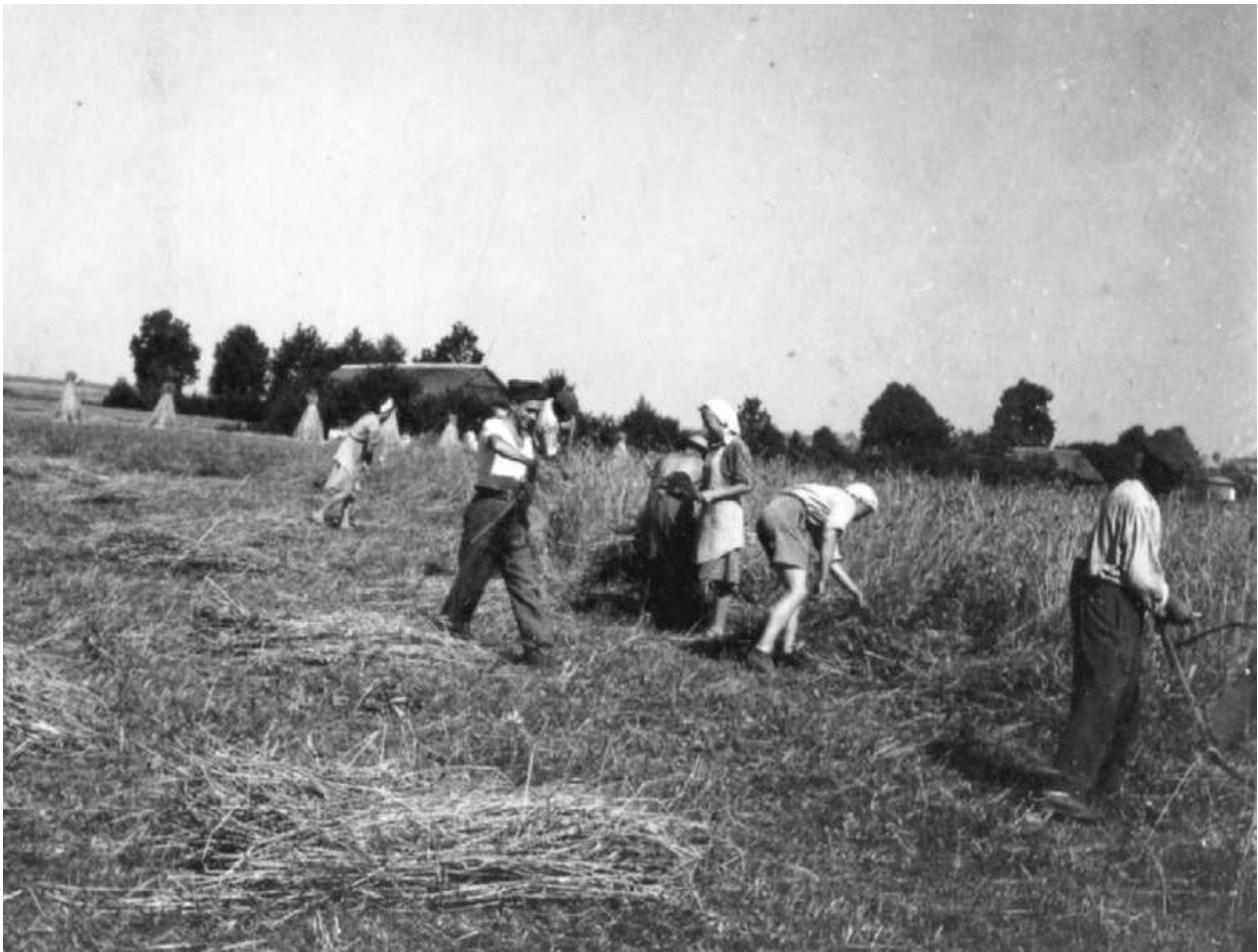
Koszenie zboża, Siepraw - Wieś II, lata 60 ub. wieku.