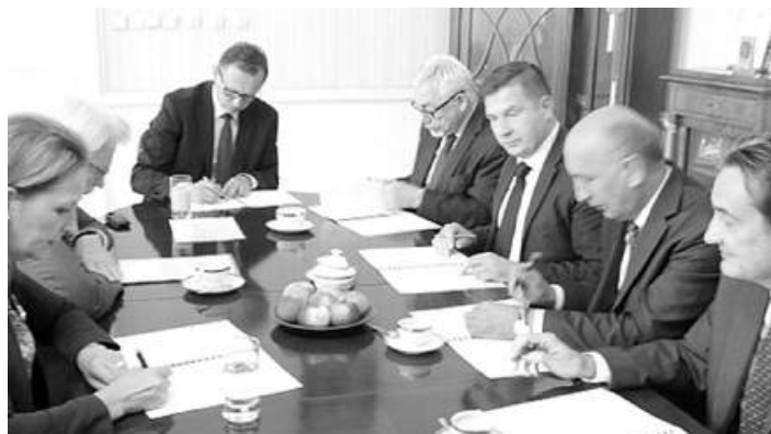
Moment podpisania Listu intencyjnego w sprawie nawiązania współpracy dla budowy linii kolejowej Kraków - Myślenice