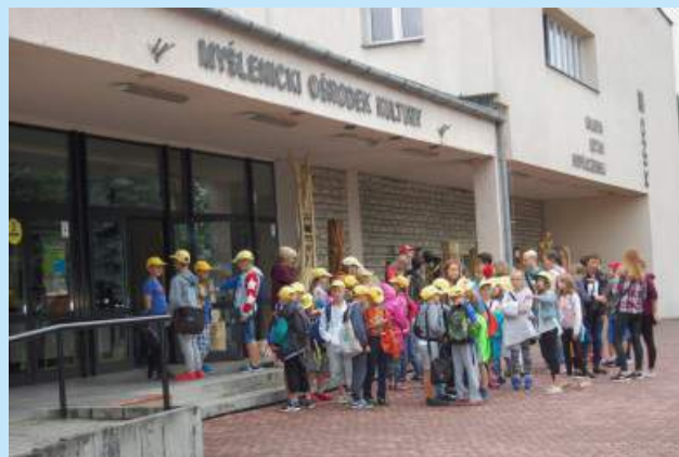
Letnie półkolonie 2017 str. 13