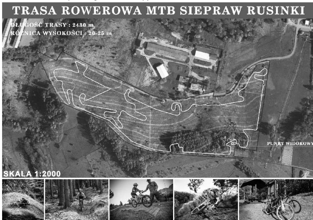
Trasa rowerowa - Siepraw Rusinki