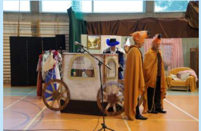
Piknik "Siepraw bez barier" str. 14