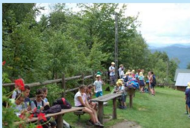
Letnie półkolonie 2017 str. 13