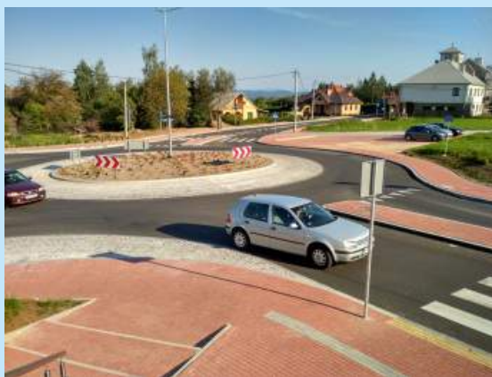
Rondo w Zakliczynie str. 8