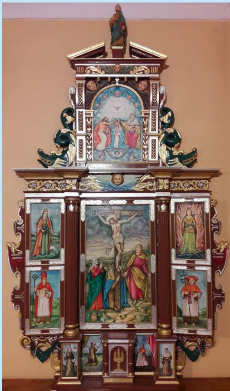
Dawny ołtarz ukrzyżowania w pierwszym kościele św. Michała Archanioła w Sieprawiu - Ołtarz otwarty